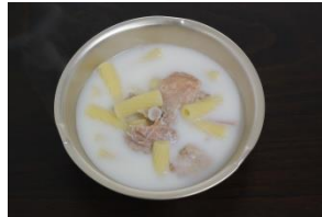
▲マカロニとさけ缶のミルクスープ