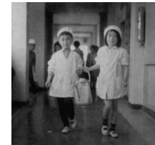
▲当時使われたミルクポット