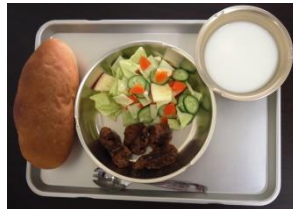
▲クジラの竜田あげとサラダ