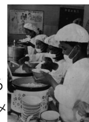
▲ごはん給食の様子