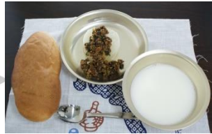
▲ふろふき大根のおかず