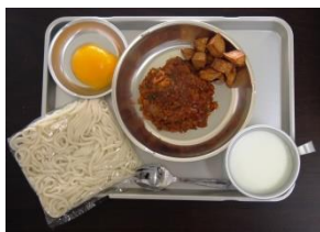
▲ソフトめんミートソース