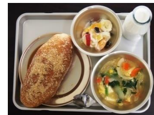
▲ピーナッツあげパン

昭和40年代 (1965~1974) ★ 脱脂粉乳から牛乳へ切り替わり、パンやおかずの種類も増える