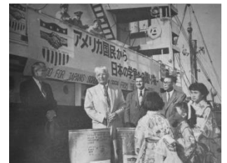
▲ドラム缶入りの脱脂粉乳